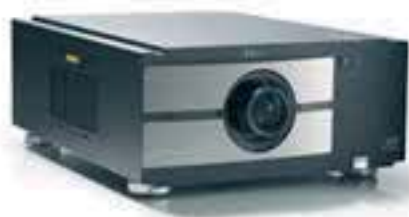
RLM W8 R9006310

Использование в оптической системе проекторов трех DLP матриц позволяет получить не только яркое и насыщенное изображение, но и существенно расширить цветовой охват. Благодаря этому проекторы способны создать на экране высококачественное изображение.