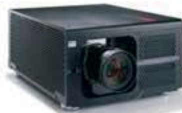
RLM W14 R9006330