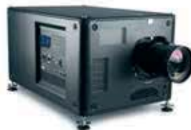
HDX W18 R9012000