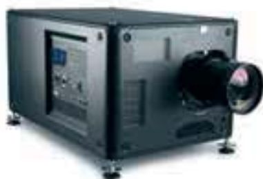
HDX W14 R9013000